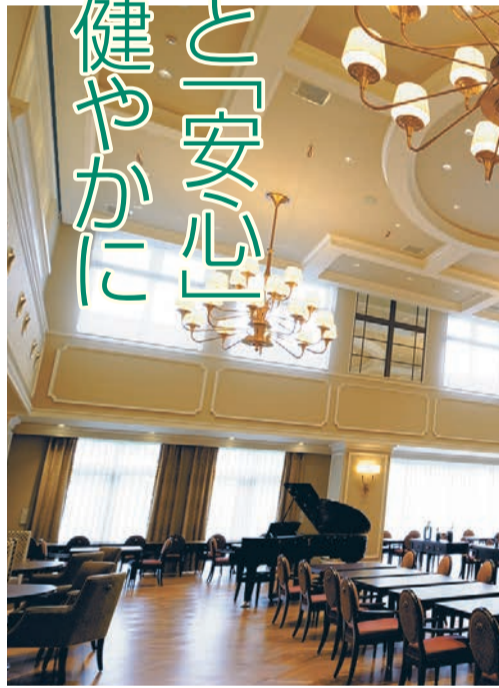
開放的な吹き抜けのメインダイニング ピアノの生演奏が聞けるイベントを行うことも

「エレガーノ西宮」は住友林業グループのスマリケンケアライフが、「住みたい街」として関西トップ級の人気を誇る西宮北口エリアにある有料老人ホームです。上質なサービスと空間をそろえ、2020年5月のオープン以来、豊かで安らぎのある暮らしの輪が広がっています。安心・安全の価値がますます大切な時代。健康な今も、そして介護が必要になっても、一人ひとりの人生をサポートしてくれる「エレガーノ西宮」の魅力をご紹介します。