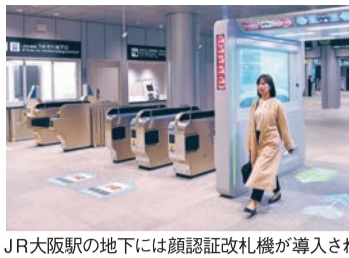
JR大阪駅の地下には顔認証改札機が導入された

これまで同駅近くの支線を通していた特急「はるか」くろしおが停車し、関西空港、和歌山方面と大阪駅間の所要時間が大幅に短縮。奈良と結ぶ直通快速も乗り入れ、JR淡路への追加停車により、阪急との乗り換えが便利になった。 JR西日本は地下駅をサービスや技術革新の実験場と位置づけ。床から天井まで全体を覆い、列車ごとに異なる扉の位置に合わせて「ふすま」のように自在に動くフルスクリーンホームドアや、顔認証改札機なども充実させていく方針だ。