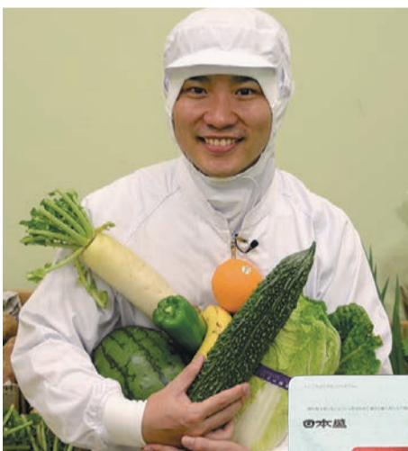
有機農園で育てられた野菜を使い、栄養を飲みやすくカプセルに

FAX・ハガキでの申込は、氏名(フリガナ)、電話番号、〒住所、生年月日、袋数、03473酵素係を明記。商品は注文確認後10日以内にお届け。支払いはクレジットカード、または商品到着後、2週間以内に郵便振替(現金支払いの場合別途110円(税込)必要)、コンビニ(手数料無料)で。但し、同社規定により代金引換・クレジットカード払いに変更になる場合あり。返品は原則未開封に限り、商品到着後7日以内(返送料自己負担)に。