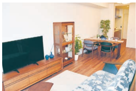
明るく暮らしやすい一般居室。 早めの相談がおすすめ

「エレガーノ西宮」は住友林業グループのスマリケンケアライフが、「住みたい街」として関西トップ級の人気を誇る西宮北口エリアにある有料老人ホームです。上質なサービスと空間をそろえ、2020年5月のオープン以来、豊かで安らぎのある暮らしの輪が広がっています。安心・安全の価値がますます大切な時代。健康な今も、そして介護が必要になっても、一人ひとりの人生をサポートしてくれる「エレガーノ西宮」の魅力をご紹介します。