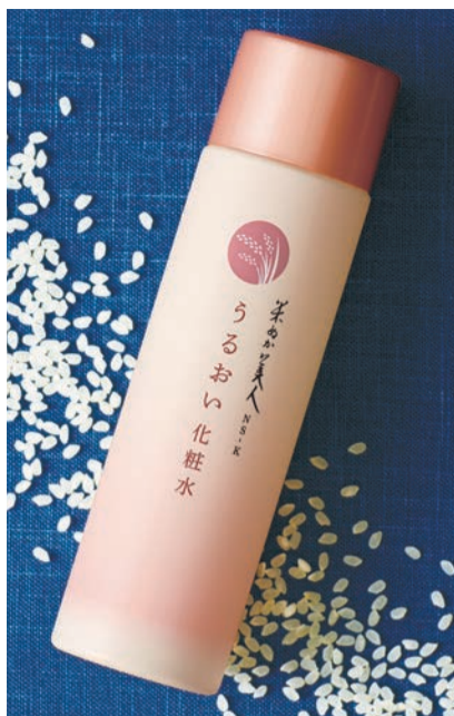
「米ぬか美人 NS-K うるおい化粧水」米ぬか*1や日本酒酵母*3など、酒蔵ならではの自然な潤いがハリ・ツヤをもたらす

「これ良いわよー」。酒販店の「奥様」の声をきかずに、口コミで人気が出た「米ぬか美人」。日本盛(兵庫西宮市)が手掛ける自然派化粧品で、30年以上たった今も選ばれ続けている。特に、通販限定ながら根強い人気を誇るのが「米ぬか美人うるおい」シリーズだ。「米ぬか」といえば「ぬか袋」。『米ぬか美人』の開発も、担当者がぬか袋を使っていたことから始まりました。『うるおい』シリーズでは米ぬか*と一緒