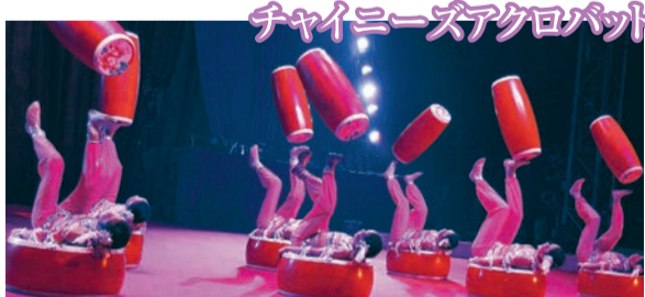
チャイニーズアクロバット 強靭(きょうじん)でしなやかな肉体のみを駆使し、飛び手が交差する危険度マックスの超絶人間トランポリン。