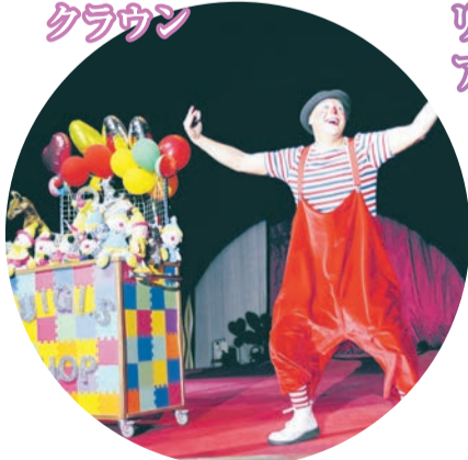
クラウン コミカルだけではなくハイレベルなパフォーマンスは必見。観客をサーカスの世界に誘い込むのがクラウンです。