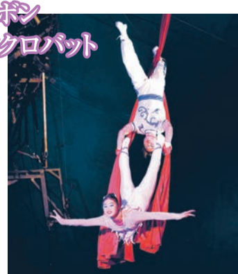
リボンアクロバット つり下げられた2本のリボンはまるで体の一部。2人が空中高く舞い上がる姿は、優雅なBGMと相まってスリルとロマンスが融合した空中のラブストーリー。

世界十数カ国から集結したトップアーティスト。迫力あるパフォーマンスを堪能しませんか。「ポップサーカス」がいよいよ西宮で開幕します。大テントで展開される圧巻の超人技。その場でしか味わえない、感動と興奮。 大型テントで全国を巡回する、日本では数少ない本格的なサーカスが西宮にやってきます。その名は「ポップサーカス」。期間は4月23日(日)〜7月2日(日)。西宮市津門飯田町の国道2号沿いに、ピンク色の特設大テントが出現します。 1996年の旗揚げ以来、大型動物を使わず人間能力の限界に挑戦するヒューマン・アクロバット・サーカスに徹してきました。トップアーティストは世界十数カ国から集結、鍛え上げられた肉体と高度なテクニックで圧巻のパフォーマンスを繰り広げます。 直径14mの円形ステージはどこから見やすく、ダイナミックな超人技に心が躍り、感動と興奮でテントは歓声と拍手であふれます。サー