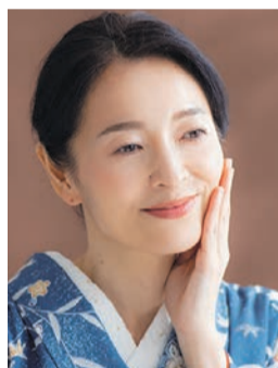
キメの整った素肌へ