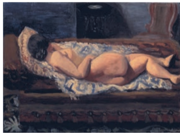
小出樽重《横たわる裸女A》 1928年 油彩、布 芦屋市立美術館蔵

終戦後 戦災を逃れた伊藤のアトリエには小磯良平をはじめ、多くの画家や文化人が集った。本展では彼と交流を持った20人の画家の作品も展示。伊藤を起点に関西の洋画界の様相をたどる構成だ。アトリエで伊藤は一般に向けた絵画教室も開き、市民が絵を学んだ。48年には芦屋市美術協会の結成にも携わるなど、芦屋の美術界に