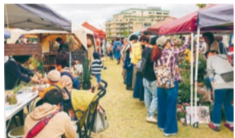
多くの来場者でにぎわう様子

◆第8回 ロハスパーク川西 @キセラ川西せせらぎ公園 22日(土)23日(日)10～16時、キセラ川西せせらぎ公園(阪急川西能勢口)。作った人の顔や思いが見えるハンドメイド雑貨やアンティーク、こだわり食材を使った手作りフード&スイーツなどが一堂に集まる恒例