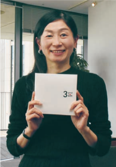
依頼者に納品されるギフトボックスの二次元コードを読み取り、音声は届けられる

「自分が生まれたころの話や両親の人生について、中年にもなる親に改めて聞くというご機嫌なんでしょうね。この「気兼ね」もある