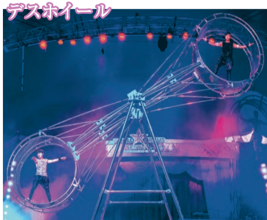
デスホイール 高速回転する腕木両端の輪の「中」と「外」を巧みに使い分け、マシンと一体化して繰り広げられる息詰まる離れ業。

次々と宙を舞う鳥人たち、多国籍チームが魅せるすごい技の数々。ダイナミックな大技が決まった瞬間、感動と興奮は最高潮に!