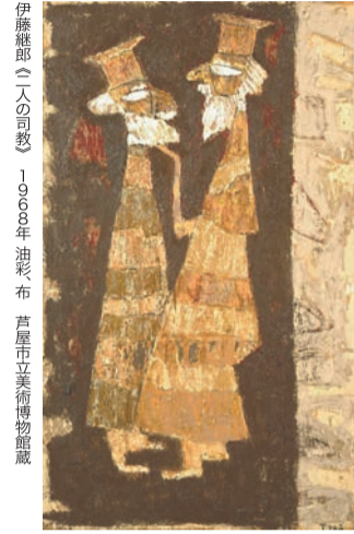
伊藤継郎(二人の司歌) 1968年 油彩 布 芦屋市立美術館蔵

芦屋市立美術館は、1991年の開館以来初となる改修工事を終え、15日(土)にリニューアルオープンする。その記念として特別展「芦屋の美術もつひとつの起点 伊藤継郎」を7月2日(日)まで開催する。