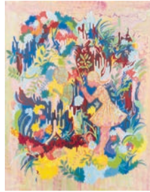
川口奈々子《hide and seek》 2022年、油彩・キャンバス