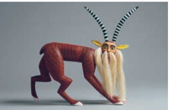
木彫(ヤギのナフム)メキシコ合衆国国立民族学博物館蔵

◆特別展 ラテンアメリカの民衆芸術 5月30日(火)まで、10～17時(入館は16時30分まで)、国立民族学博物館特別展示館(大阪モノレール万博