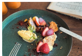
「朝菓子の会」の一例

京都・銀閣寺から徒歩6分、アンティーク家具などに囲まれて菓子を楽しめるお店です。洋酒やスパイスと季節の果物を合わせた「パフェ」が人気。コーヒーや紅茶もありますが、スパークリングワイン、ラムなどのお酒と合わせられるのが同店ならではのひと匙ごとに味わいに変化するパフェを、ゆっくりとお酒とともにどうぞ。完全予約制の「朝菓子の会」もあり、4品と小さなドリンク付きで10時開始。京都の小旅行のスタートにもぴったりです。