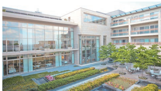
「サンシティ宝塚」暮らしの中で四季の移ろいを感じられる中庭