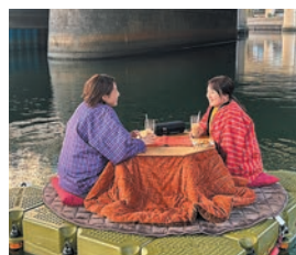
大阪・東横堀川で