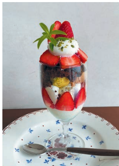
「季節のパフェ」。仕入れの果物や食材により組み合わせが変わります

京都市左京区浄土寺上南田町37-1 12:00~17:00 (「朝菓子の会」10:00~12:00、予約制) 水曜定休、他不定休あり 予約、問い合わせはインスタで @kashihate.kyoto