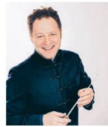
ジョン・アクセルロッド

前半は2024年に没後100年を迎えるブッチーニの特集。数々の名演で芸術文化センターを沸かせてきた森麻季(ソプラノ)、林美智子(メゾソプラノ)が華やかに登場。来夏の佐渡裕芸術監督プロデュースオペラ2024「蝶々夫人」上演に先駆け、