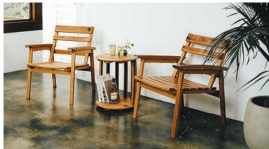
上) 樽のフォルムをやわらかなデザインで表現した「TARURU」のダイニングテーブルとチェア 下) ウイスキー樽に包まれるようなゆったりとした座り心地のリラックスチェア。屋外でも使えます