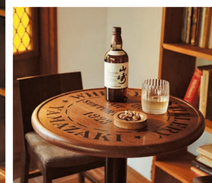
「山崎」「白州」から天板デザインを選べるバーテーブル(直径55cm)。周りに立ち上がりがあり、万が一グラスを倒しても床をぬらしません