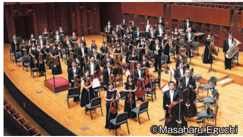
日本センチュリー交響楽団