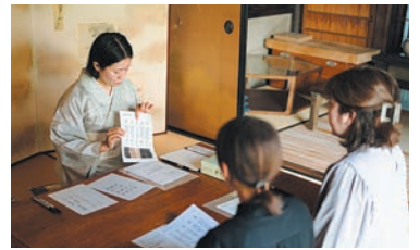
中庭を望む茶室で、書に向き合います。先生の筆の運びを間近で見られる貴重な機会

出身地の広島で企業に5年勤めていましたが、書を仕事にすると決意。「社会に出て初めて、色々なことを仕事にしている人がいると気づきました。私も好きな書を仕事にしてい