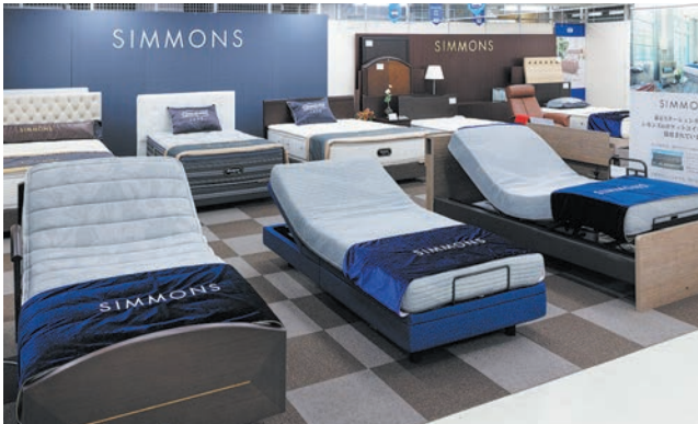
シモンズやフランスベッドといった高級ベッドをはじめ、ソファなどの大家具も充実の品揃え。高額アイテムこそジェットでどうぞ(インテリア館)

人気のインポートブランドも充実。東館5階のフロアに、憧れの一流ブランドのバッグや財布をはじめ、ファッションアイテムが多数。気に入ったアイテムはお見逃しなく!