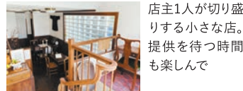
店主1人が切り盛りする小さな店。提供を待つ時間も楽しんで

京都・銀閣寺から徒歩6分、アンティーク家具などに囲まれて菓子を楽しめるお店です。洋酒やスパイスと季節の果物を合わせた「パフェ」が人気。コーヒーや紅茶もありますが、スパークリングワイン、ラムなどのお酒と合わせられるのが同店ならではのひと匙ごとに味わいに変化するパフェを、ゆっくりとお酒とともにどうぞ。完全予約制の「朝菓子の会」もあり、4品と小さなドリンク付きで10時開始。京都の小旅行のスタートにもぴったりです。