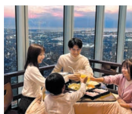
あべのハルカス展望台