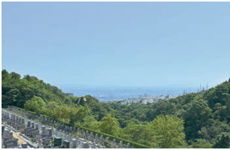
神戸ならではの雄大な景観