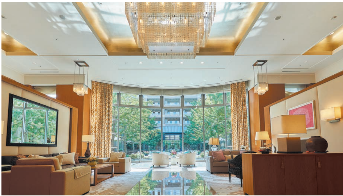
「サンシティパレス塚口」エントランスロビーは開放感あふれる上質空間