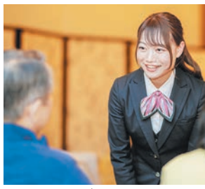
スタッフは入居者とのコミュニケーションを大切にします

将来介護が必要になった場合は、介護居室にて24時間体制のサービスを提供。要介護者1.5人を1人以上のケアスタッフが支え、看取りまでトータルにサポートします。入居時から介護・看取りまで、全スタッフが情報を共有しているため、ワンストップできめ細かなパーソナルケアを実現できます。