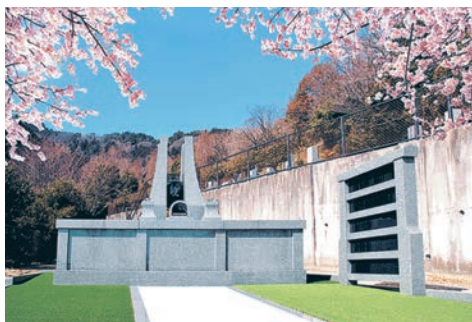
永代供養 合祀塔「空—SORA—」