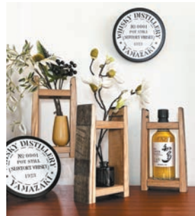
フリーフレームなど、インテリア雑 貨も豊富

家具以外にも、コースターや プレート、箸などのテーブル ウエア、ボールペンといった小物 類も充実。中には、ウイスキー 樽を窯の燃料として使用し、 さらに、その樽灰から作られ た釉薬を使って焼成された信 楽焼のカップ&ソーサーや飯 碗、一輪挿しなども。長い年月 の物語が刻まれた他にはないア イテムの数々は、ギフトや新年 の買い替えにもおすすめです。 形を変えてなお、暮らしを 彩るサントリー樽ものがたり の家具や小物。お気に入りを見 つけに、お店を訪れてみませ んか。