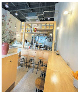
イトインはカウンタースタイルで8席

イタリアのBar(バー)のように一口サイズの「フィンガースイーツ」とお酒が楽しめる新町の人気店。ラインアップは季節によって変わり、常時16種類ほどが並びます。小さなサイズに合わせたレシピを考案し、味にアクセントを利かすのがこだわり。お酒の種類も多数あり、どのお酒と組み合わせるかを悩むのも楽しみ。もちろんカフェ利用も歓迎。可愛くて手土産に喜ばれるとテイクアウトも多いそうです。クリスマスはホールサイズも登場予定。